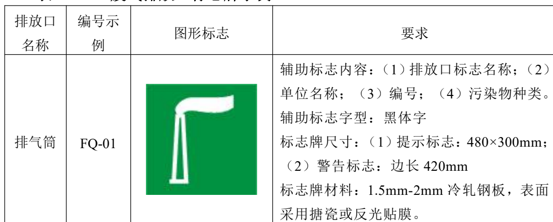
表 4-5 废气排放口标志牌示例

注意：采样口必须具备封堵盖板、闸板或管帽，确保在排气筒采样口非检测时间处于密闭状态。