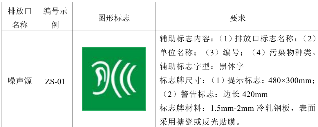
表 4-10 噪声排放口标志牌示例